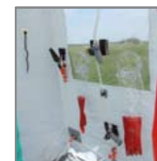
Okno s rukavicemi, ruční sprcha, kartáč