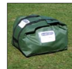
Sprcha v tašce