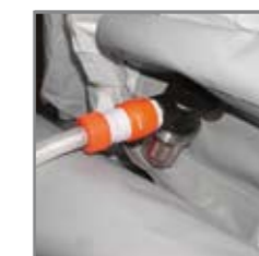
Přívod vody do sprchy