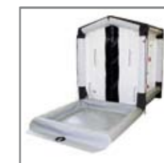
Sprcha s integrovanou předvanou